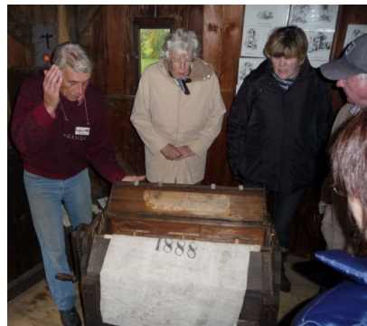
Popo-Klatschmaschine des Müllers