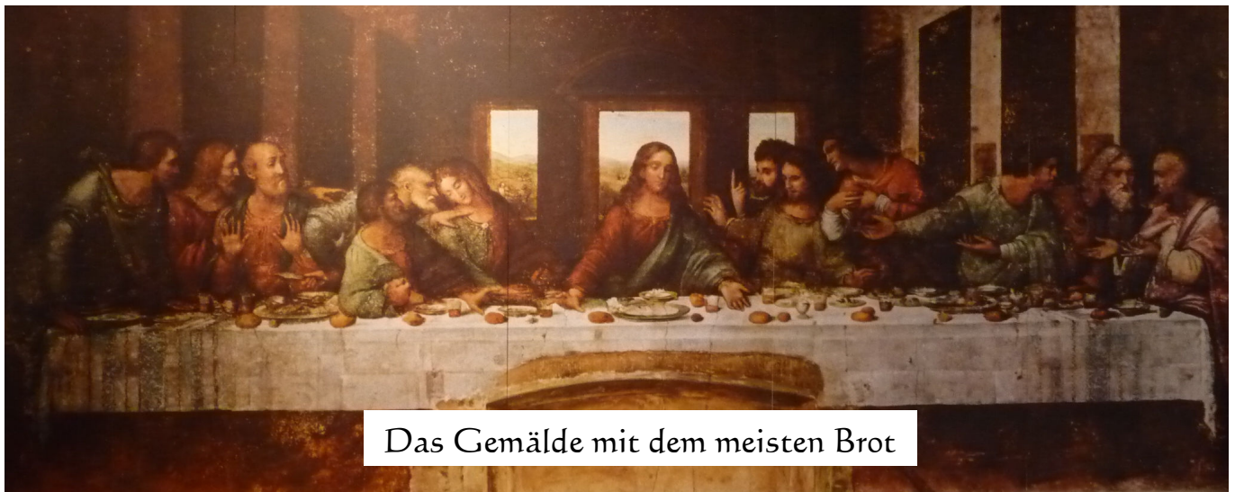
Das Gemälde mit dem meisten Brot